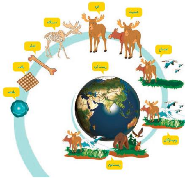
شکل ۳- سطوح سازمان یابی حیات

یاخته پایین ترین سطح سازمان یابی حیات است. همه ی جانداران از یاخته تشکیل شده اند.